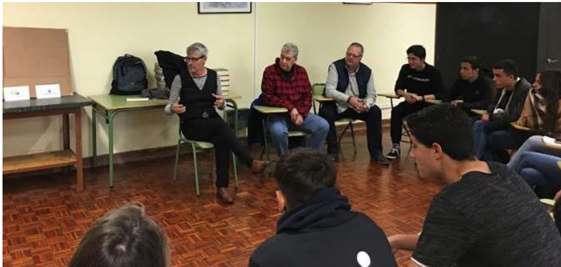
Otra instantánea de la actividad