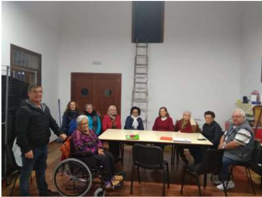
Hogar del Pensionista