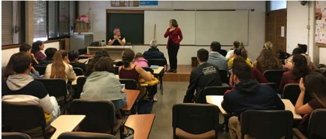
Dos de los ponentes ante el alumnado.