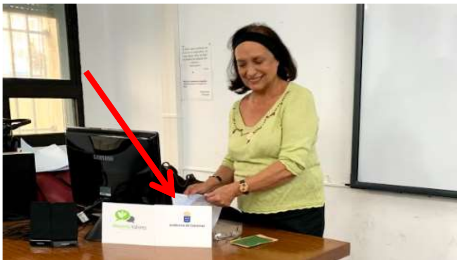
Dulce en un momento de su ponencia