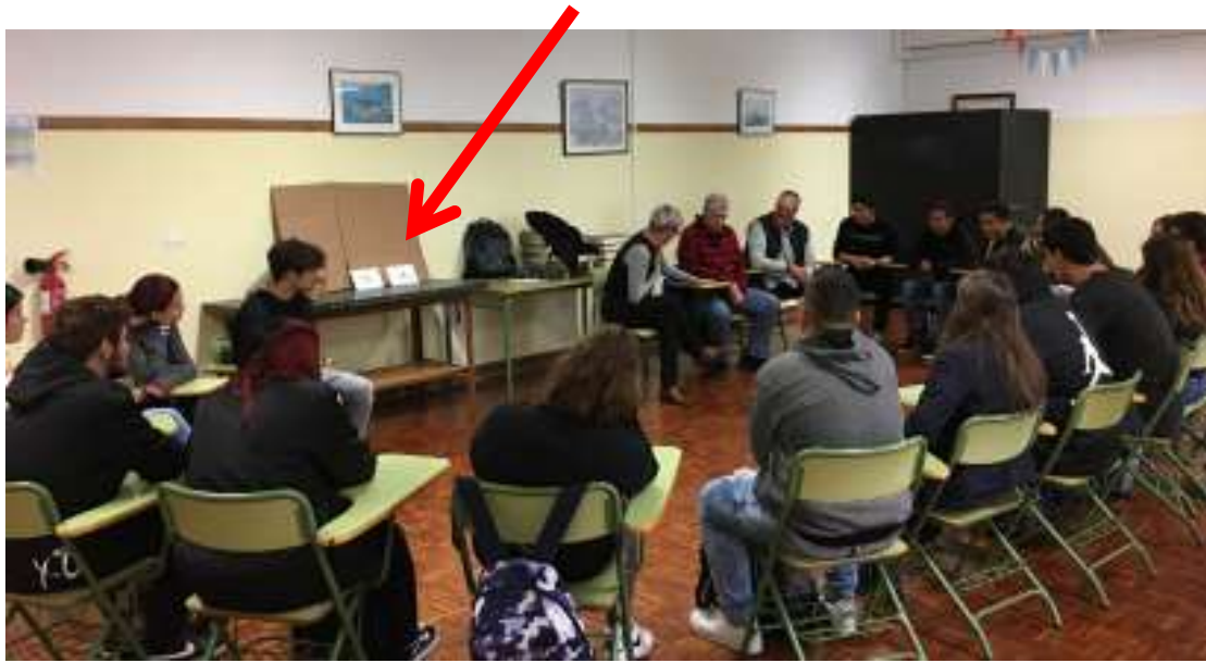
Instantánea de la actividad